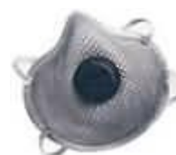
2310N95 Partículas Premium