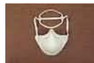
EZ 22 Respirador de una sola banda aprobado por la NIOSH