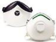
SAF-T-FIT-N1125 Mascarilla para uso de particulas