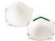
SAF-T-FITMASC-N Mascarilla de proteccion basica N95