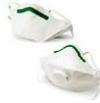
SAF-T-FITMASC-N Proteccion de particulas en aerosoles libres de aceites