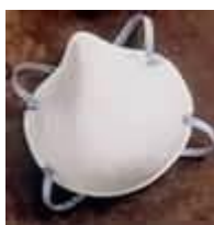
2200N95 Con malla plástica Dura-Mesh

CARTUCOS (POLVOS LIGEROS, PARTICULAS, PARTICULAS A BASE DE ACEITE, A BASE DE VAPORES ORGANICOS) PREFILTROS, RESPIRADORES COMPLETOS.