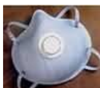
2300N95 Con malla plástica Dura-Mesh