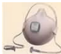
2730N95 Partículas alta eficiencia