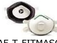
SAF-T-FITMASC-P P95 Proteccion de vapores organicos molestos.