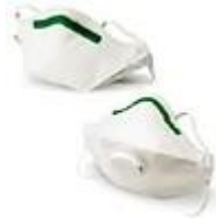
SAF-T-FITMASC-N Proteccion de particulas en aerosoles libres de aceites

SUMINISTROS INDUSTRIALES MORSAN, S.A. DE C.V. ARTICULOS DE SEGURIDAD, LIMPIEZA, REFACCIONES Y HERRAMIENTAS PARA LA INDUSTRIA TELS.: 53613214 5397 7778 Y 5365 4291 silsa2@todito.com