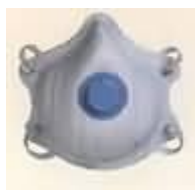
2500N95 Particulas y gases ácidos