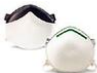
SAF-T-FIT-P115 Proteccion sugerida P95.