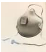
2700N95 Banda ajustable handystrap con seguro