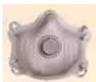
2315N95 Partículas Premium