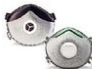
SAF-T-FITMASC-N Proporciona proteccion N95 contra gases acidos