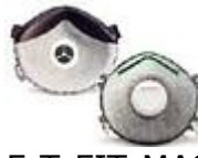
SAF-T-FIT-MASCN Mascarilla para bajos niveles de vapores en concentraci3n da