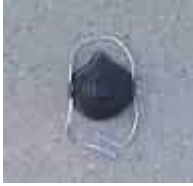
M2700 Color negro con banda ajustable handystrap

SUMINISTROS INDUSTRIALES MORSAN, S.A. DE C.V. ARTICULOS DE SEGURIDAD, LIMPIEZA, REFACCIONES Y HERRAMIENTAS PARA LA INDUSTRIA TELS.: 53613214 5397 7778 Y 5365 4291 silsa2@todito.com