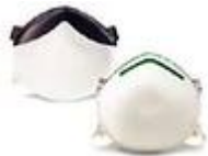
SAF-T-FITMASC-N Mascarilla para el de particulas en aerosoles