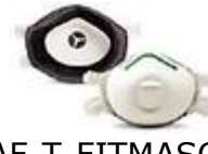
SAF-T-FITMASC-N Proteccion combinada N99.