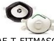
SAF-T-FITMASC-P Protecci3n P95